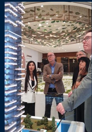
Besuch bei DAMAC Properties

Hier klicken, um das Interview anzuschauen.