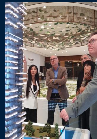
Besuch bei DAMAC Properties