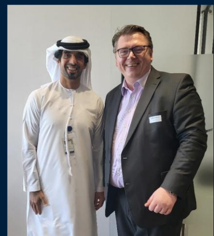
Meeting beim Abu Dhabi Investment Office (ADIO)