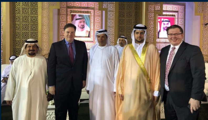
Mit Mitgliedern der Königlichen Familie während der Königlichen Hochzeit in Dubai

Unser Reise-Video auf YouTube (Einfach auf das Bild klicken!)