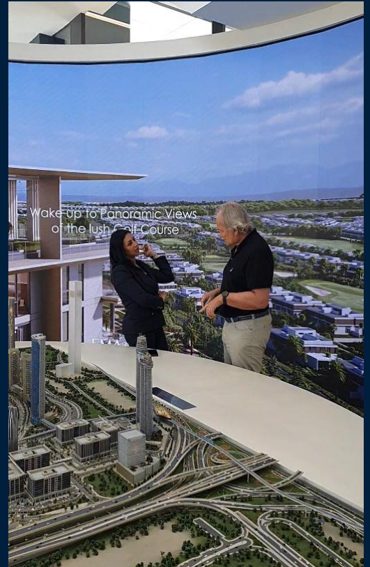
Besuch des VIP-Showrooms der EMAAR Properties