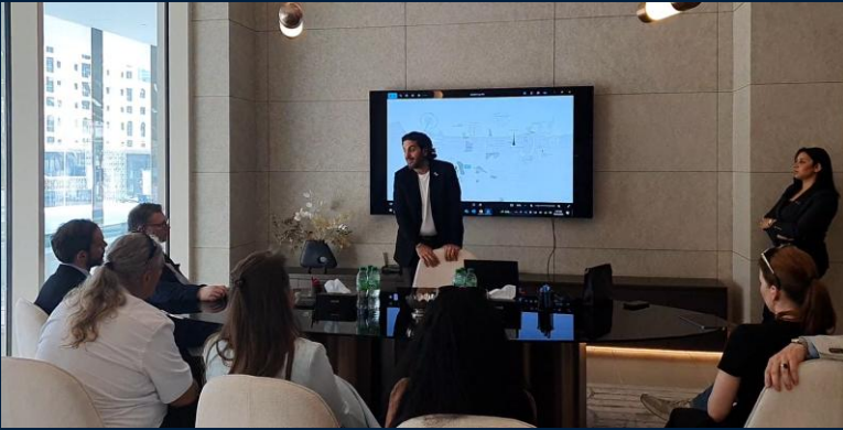
Besuch des VIP-Showrooms der EMAAR Properties